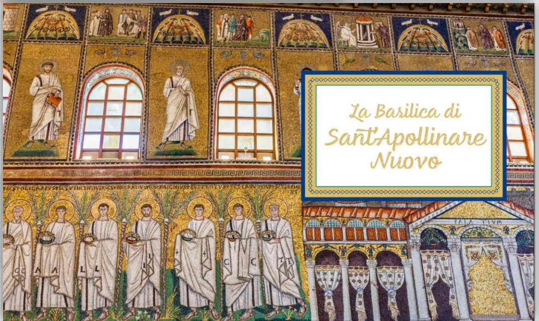
La Basilica di Sant'Apollinare Nuovo